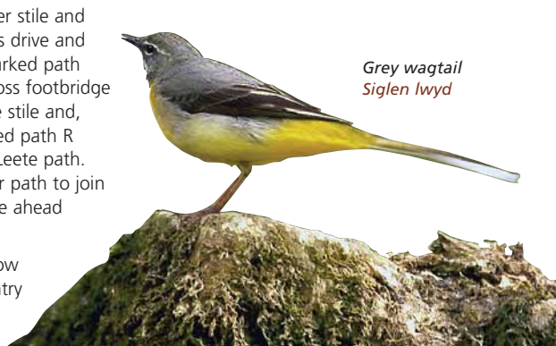
Grey wagtail Siglen lwyd

Thro' KG behind kennels and follow path back into Loggerheads Country Park. Ignore footbridge on R and continue along path with river on R. Cross over stone bridge and walk back to Countryside Centre and car park.