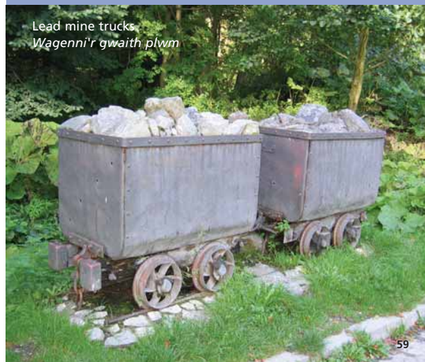
Lead mine trucks Wagenni'r gwaith plwm

Daw enw 'Llwybr y Lît' o'r enw tafodieithol Saesneg am sianel sy'n cyrchu dŵr i rod y felin. Yn wreiddiol, roedd y sianel yn 2 fetr o led ac yn 1.5 o ddyfnder. Adeiladwyd yn 1823 ar gyfer cwmni Mwyngloddio'r Wyddgrug. Ei amcan oedd troi'r dŵr o'r afon yn Loggerheads er mwyn osgoi'r tyllau sydd yn y calchfaen ble mae'r afon yn diflannu yn yr haf, gan yrru'r dŵr i'r olwynion a chreu ynni i'r peiriannau mwyngloddio a'r pypmiau oedd i lawr yn y cwm. Peidiodd â gweithio yn 1845.