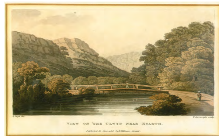
'Golygfa ar y Clwyd ger Eyarth' gan Edward Pugh 'View on the Clwyd near Eyarth' by Edward Pugh