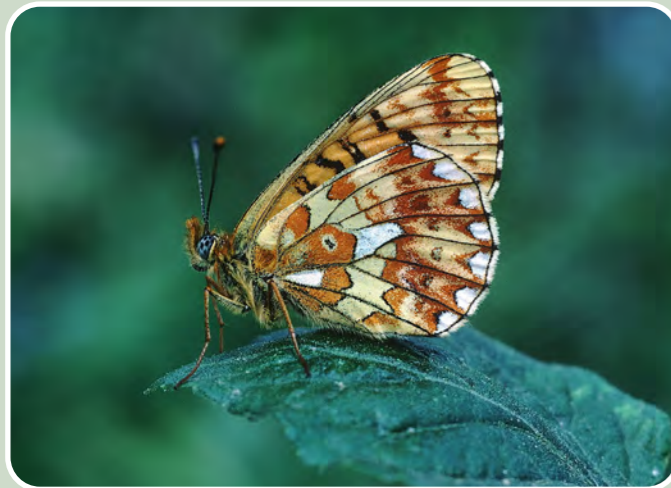
Brith Perlog / Pearl-Bordered Fritillary

Craig Adwy-Wynt, safle sy'n cael ei reoli gan y Mudiad Cadwraeth glöynnod Byw, yw un o'r safleoedd gorau i löynnod byw yng Ngogledd Cymru, gyda 32 allan o'r 34 sydd i'w gweld yn yr ardal yma wedi'u cofnodi ar yr esgair galchfaen. Mae'r safle'n cael ei reoli'n benodol ar gyfer y brith perlog, un o'n glöynnod byw sy'n wynebu'r bygythiad mwyaf. Mae pori gan ddefaid yn cadw'r prysgwydd dan reolaeth ac yn helpu fioled y cŵn i ledau o dan y rhedyn. Mae'r benywod yn dodwy eu hwyau ar y fioledau, sy'n fwyd i'r lindys.