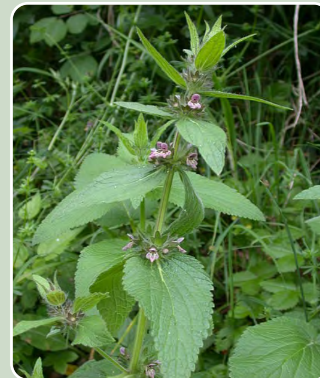
Briwlys y Galchfaen / Limestone Woundwort

Mae heidiau o'r gwybedog brith nodedig yn dychwelyd bob mis Ebrill i nythu yn y coetiroedd ac i fwydo ar yr holl lindys a phryfed yn y canopi. Gwnaed 50 o flychau nythu gan wirfoddolwyr o'r gymuned leol, i nodi pob un o'r 50 mlynedd mae'r Ymddiriedolaeth wedi bod yn berchen ar y warchodfa.