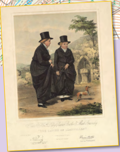
The Rt. Honble. Lady Eleanor Butler & Miss Ponsonby "The Ladies of Llangollen".